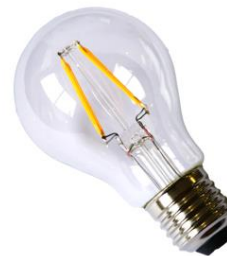
PYRAMIDE 5W – E27