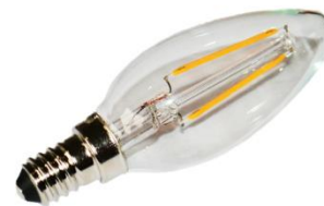
PYRAMIDE 3W – E14